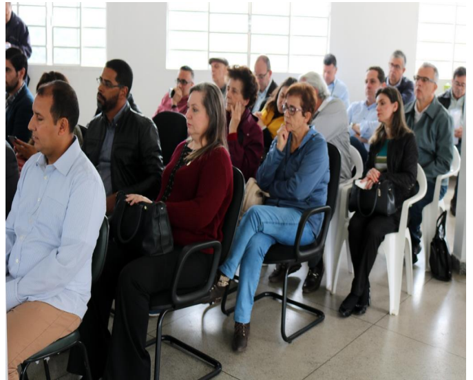
ASSEMBLEIA EXTRAORDINÁRIA 24/09/2019 – Sede do Conisud.