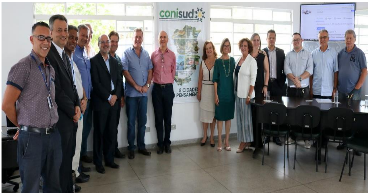
ASSEMBLEIA ORDINÁRIA – 31/10/2019 – Sede do Conisud.