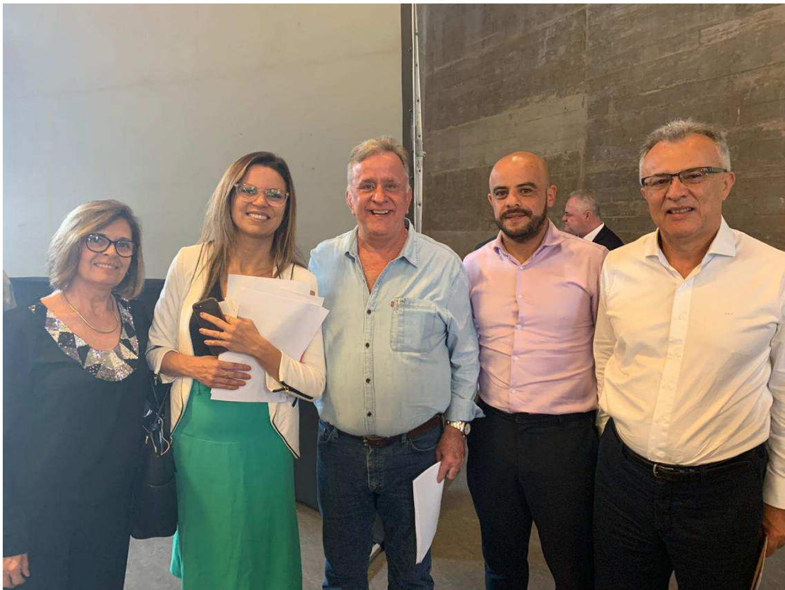
CONSELHO DE DESENVOLVIMENTO DA REGIÃO METROPOLITANA DE SÃO PAULO 12/12/2019 – PAÇO DAS ARTES.