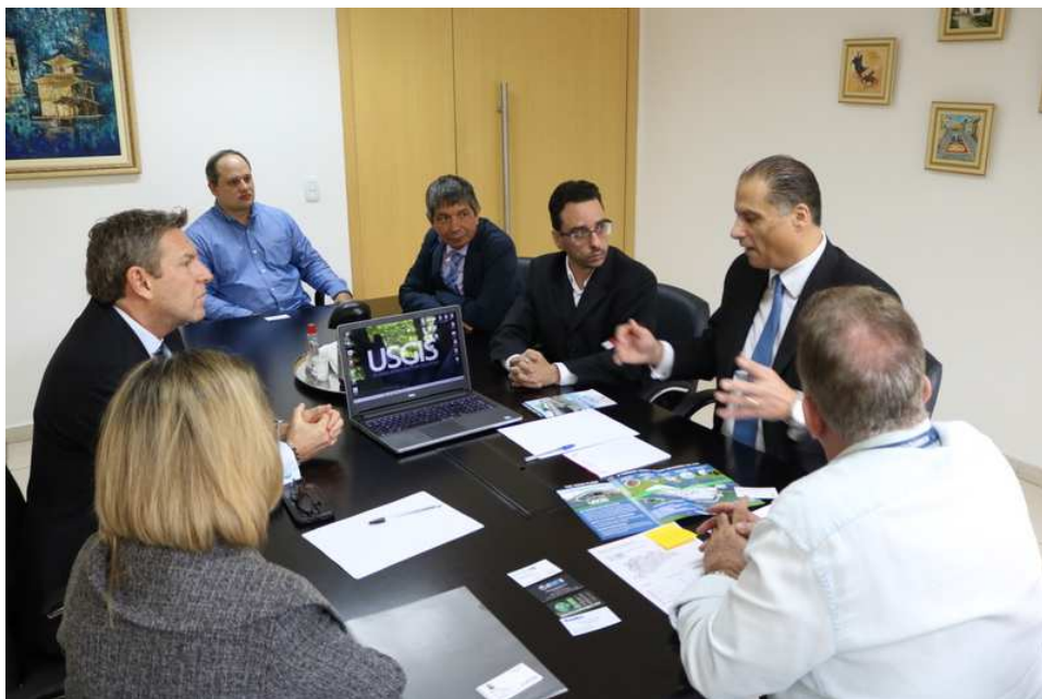
VISITA DE EMPRESÁRIOS AMERICANOS - 21/10/2019 – PREFEITURA DE ITAPECERICA DA SERRA.