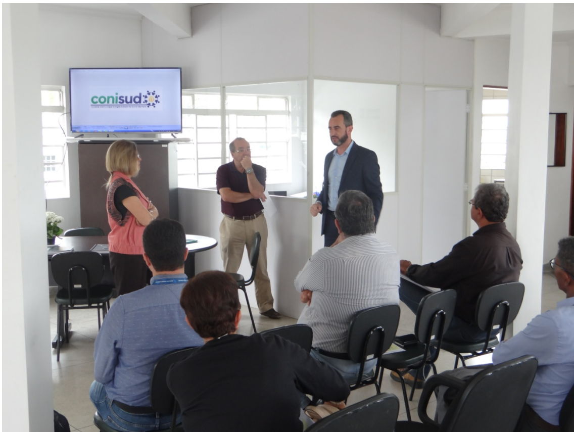
2ª REUNIÃO DO CONSELHO DE REPRESENTAÇÃO - 07/11/2019 – Sede do Conisud.