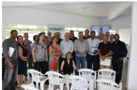
REUNIÃO GERAL – 05/12/19 – Sede do Conisud.